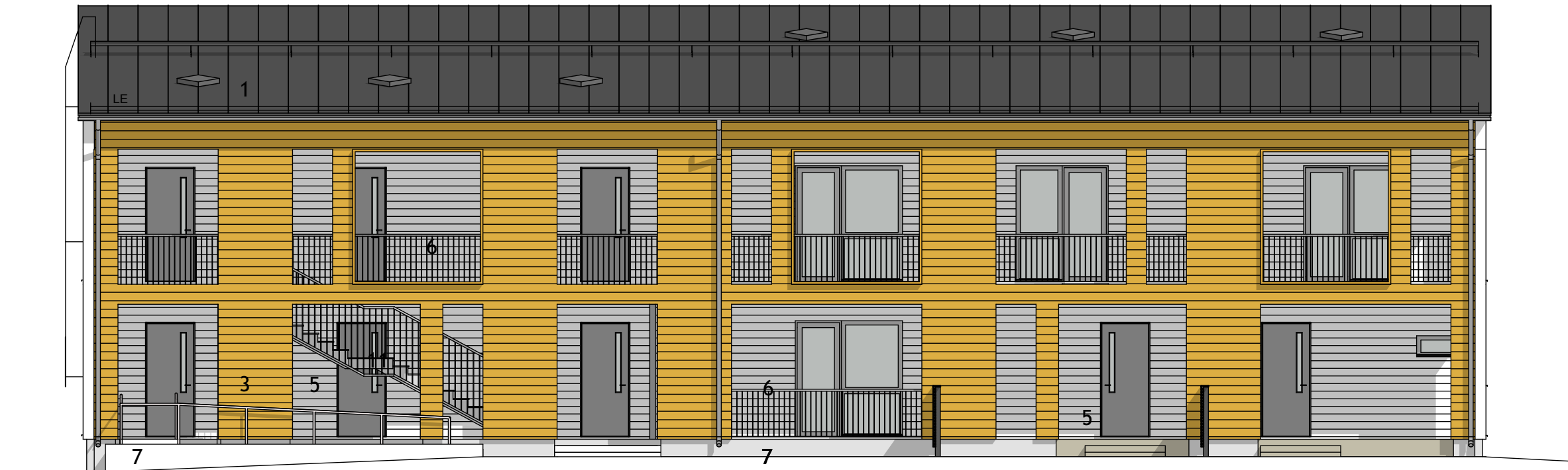
JULKISIVU LÄNTEEN 1:100