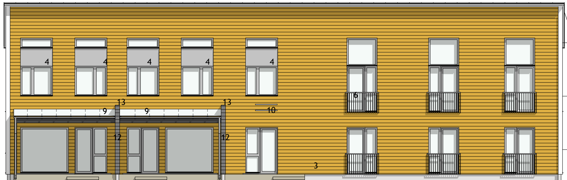
JULKISIVU ITÄÄN 1:100

IKKUNAT JA OVET, HARMAA RR 22, IKKUNAN SIVU- JA VESI PELLIT HARMAA RR22 VESIKOURUT JA SYÖKSYT, HARMAA RR 22 TALOTIKKAAT, HARMAA RR 22 KATTOTURVATUOTTEET, TUMMAN HARMAA RR 23 KATON REUNA- JA VESIPELLIT, TUMMAN HARMAA RR23 PUU PILARIT JA PALKIT TUMMAN HARMAA, TIKKURILAN 612X ULKO-OVI KASKIPUU TITANIA "PROTEUS"